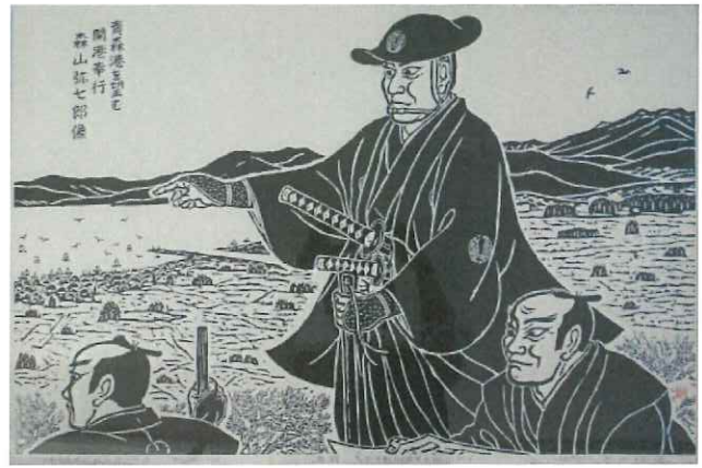
津軽藩開港奉行 森山弥七郎 2025年、青森港開港400年。 青森市の発展は、森山による青森港開港から始まりました。青森市の版画家山口晴温(やまぐちせいおん)の作です。